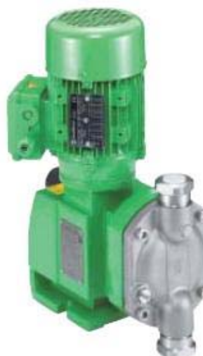
ProCam Smart DS 500

1-Pumpenkopf / 2-Membranbruchüberwachung / 3- Getriebeverbindung / 4- Getriebe / 5-Hubverstellung / 6- Deckel (Anbaumöglichkeit) / 7-Motor / 8-Motorverbindung