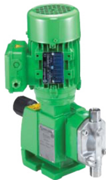
ProCam Smart DS 50

1-Pumpenkopf / 2-Membranbruchüberwachung / 3- Getriebeverbindung / 4- Getriebe / 5-Hubverstellung / 6- Deckel (Anbaumöglichkeit) / 7-Motor / 8-Motorverbindung